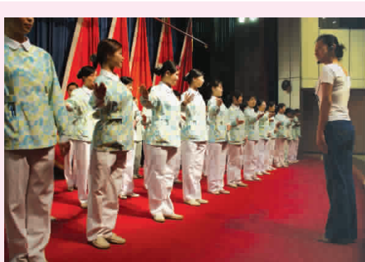
8月7日,护理部对新来院护士进行形体礼仪培训。从她们的一颦一笑、举手抬足等细节入手,强化护士礼仪,从而进一步提升我院护理水平的整体提高。(曾理报道)

“微笑列车”是美籍华人王嘉廉先生于1999年在美国发起并正式注册的非营利性慈善组织。这个组织的宗旨是为贫困的唇腭裂患者实施矫治手术。据我院口腔颌面外科主任谭颖毅教授介绍,凡是年龄在3个月至40周岁的唇裂、腭裂、唇腭裂的患者或手术后外形及功能仍不满意的患者都可以前往我院享受“微笑列车”的优惠手术治疗。