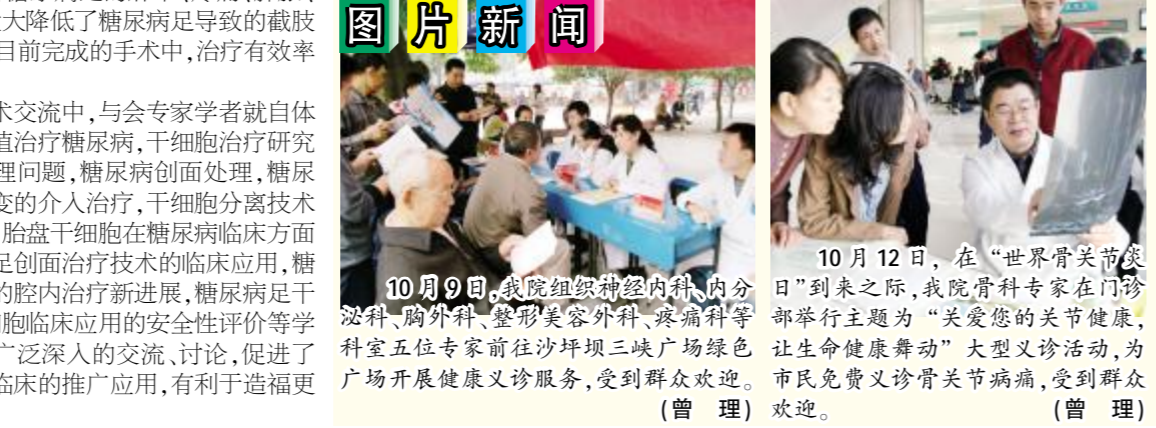
10月9日,我院组织神经内科、内分泌科、胸外科、整形美容外科、疼痛科学... 10月12日,在“世界关节病日”到来之际,我院骨科专家在门诊部举行主题为“关爱您的关节健康,让生命健康舞动”大型义诊活动... 10月9日,我院组织神经内科、内分泌科、胸外科、整形美容外科、疼痛科学... 10月12日,在“世界关节病日”到来之际,我院骨科专家在门诊部举行主题为“关爱您的关节健康,让生命健康舞动”大型义诊活动...