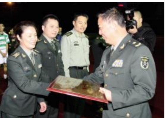
图为学校张副书记为我院足球队颁发冠军奖杯