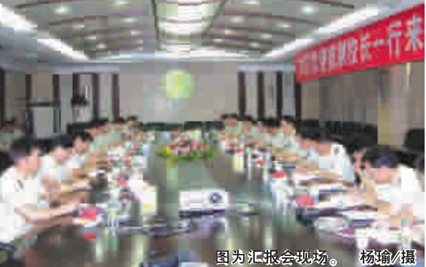
图为汇报会现场。