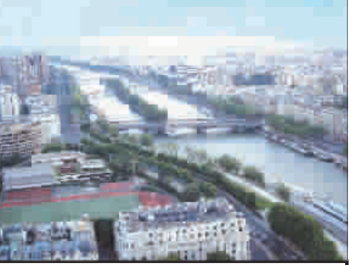
心桥 文艺副刊 《巴黎·夏日的赛纳河》

这几天我因工作关系接待了一个下海的军人,他是山东日照人,在部队当了20多年兵,戴着中校军衔转业到地方在银行部门工作。2000年,他放弃银行副行长的职位,突然退职,白手起家干起了金属名片这个项目。 我不相信他只是为了挣更多的钱,因而总是想探究他下海的最直接的想法。今天晚上,在请他吃火锅的时候,我听他说到他来重庆这些天的感觉。他告诉我们说:到重庆来这些天,他不能找到东南西北(重庆特殊的地理环境让很多北方来的人都晕头转向),虽然住在安全的宾馆,也因为不能确定自己在某个确定的方位而感到着急!就在这一刻,我一下子明白了他为什么