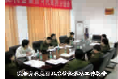
联合片代表团汇报院党委工作报告